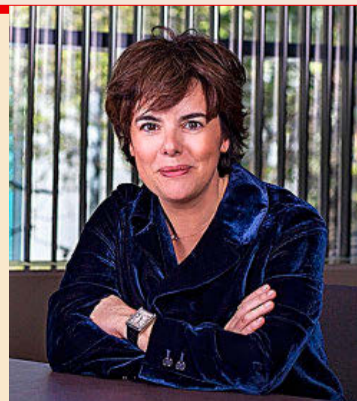
Soraya Sáenz de Santamaría, socia de Cuatrecasas.

El pasado ejercicio destacó por los grandes fichajes protagonizados por los despachos. Si bien EY Abogados fue el que más movimientos realizó, Cuatrecasas firmó el más sonado: Soraya Sáenz de Santamaría, exvicepresidenta del Gobierno, se convirtió en socia de la firma en marzo.